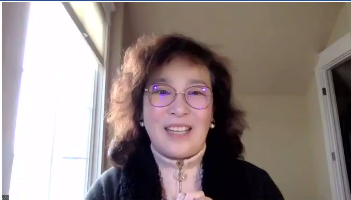
金瓔老師分享學習遊戲化的教學設計