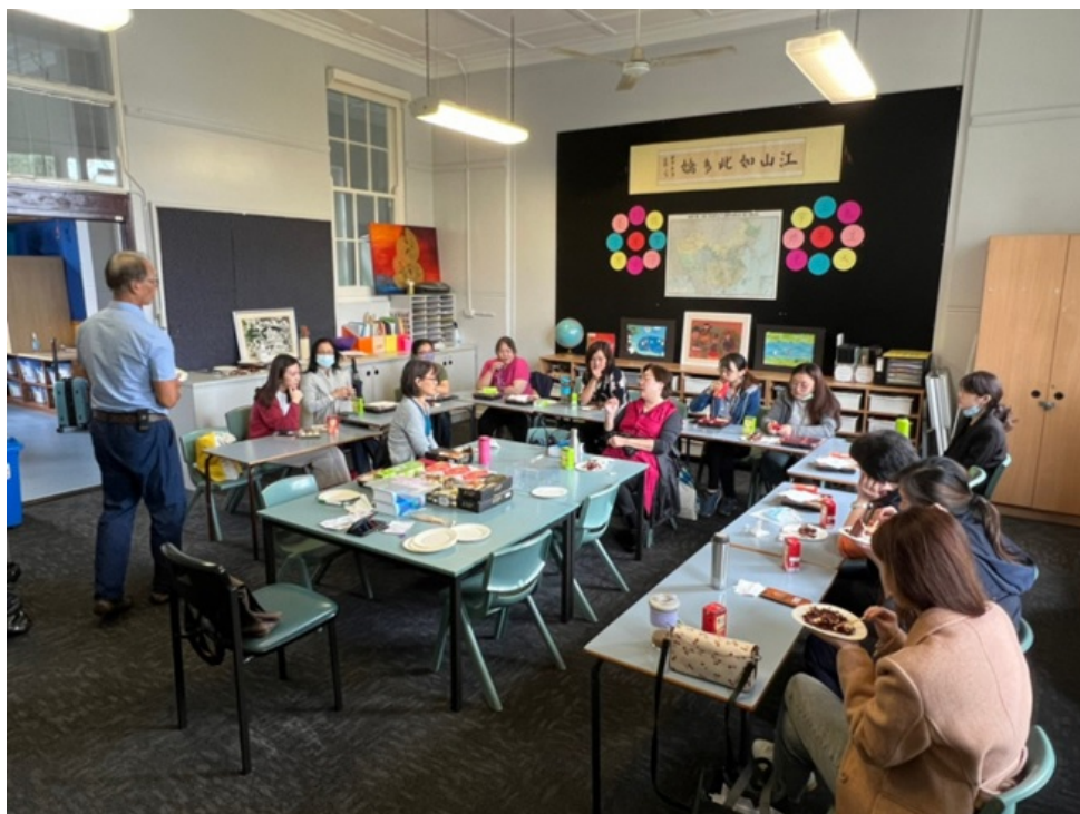
現場教教師們分享專業意見

會中老師們也分享一些備課與教學的小撇步和歷年來自己的教學實務個案，讓與會老師們功力大增、收穫滿滿、獲益良多。雪梨臺灣學校校長表示未來都會持續辦理各種不同形式的教學研習研討與會議，讓老師們自我鞭策不斷的學習成長、讓分享與傳承散發出知識的光芒，讓老師們更能精進自己的教學知能與技巧，期許能為海外僑界莘莘學子提供最優質的華語教學與服務。