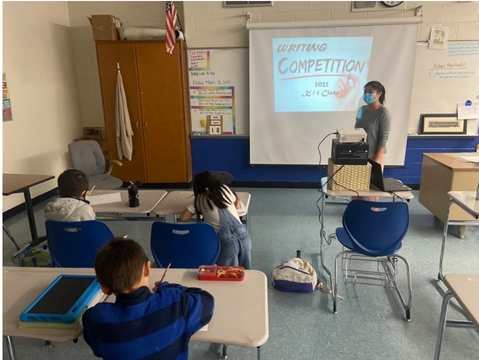
一年級學生參加寫字比賽。