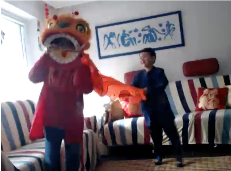
小朋友在線上表演舞獅