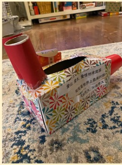
第一名 幼小誠班 黃莘昕