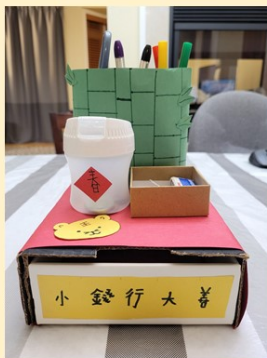
第一名 四年誠班 李正之