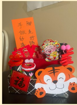
第一名 幼大誠班 鄭允和