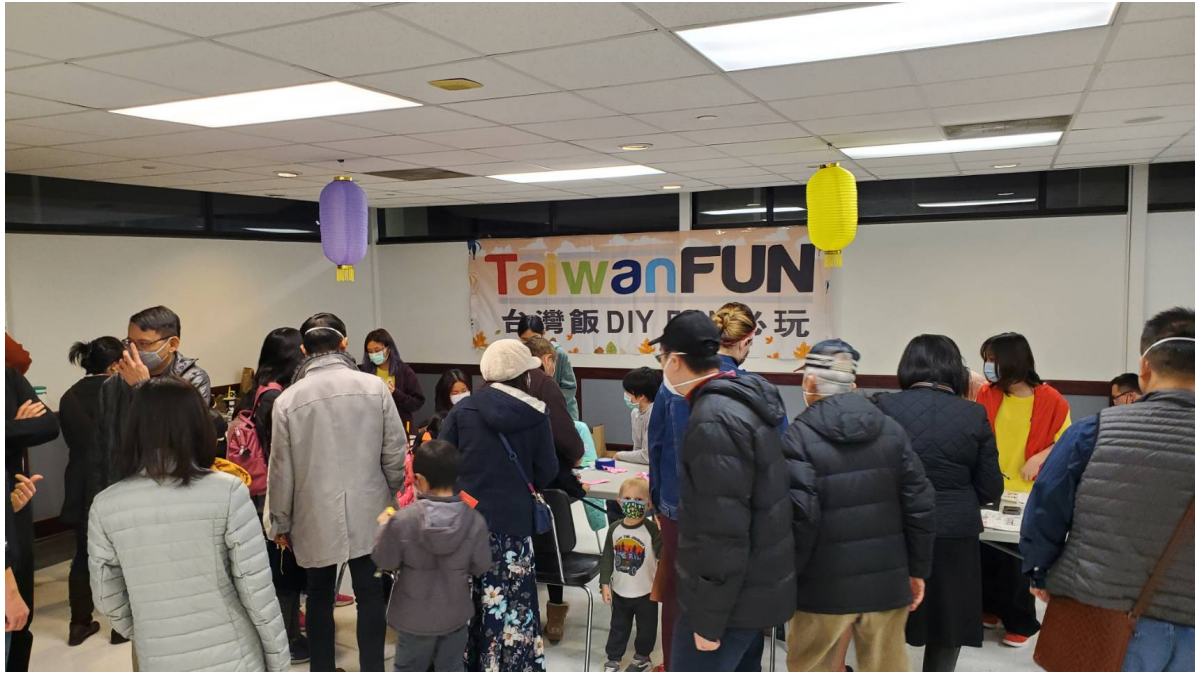
在地民眾體驗文化攤位