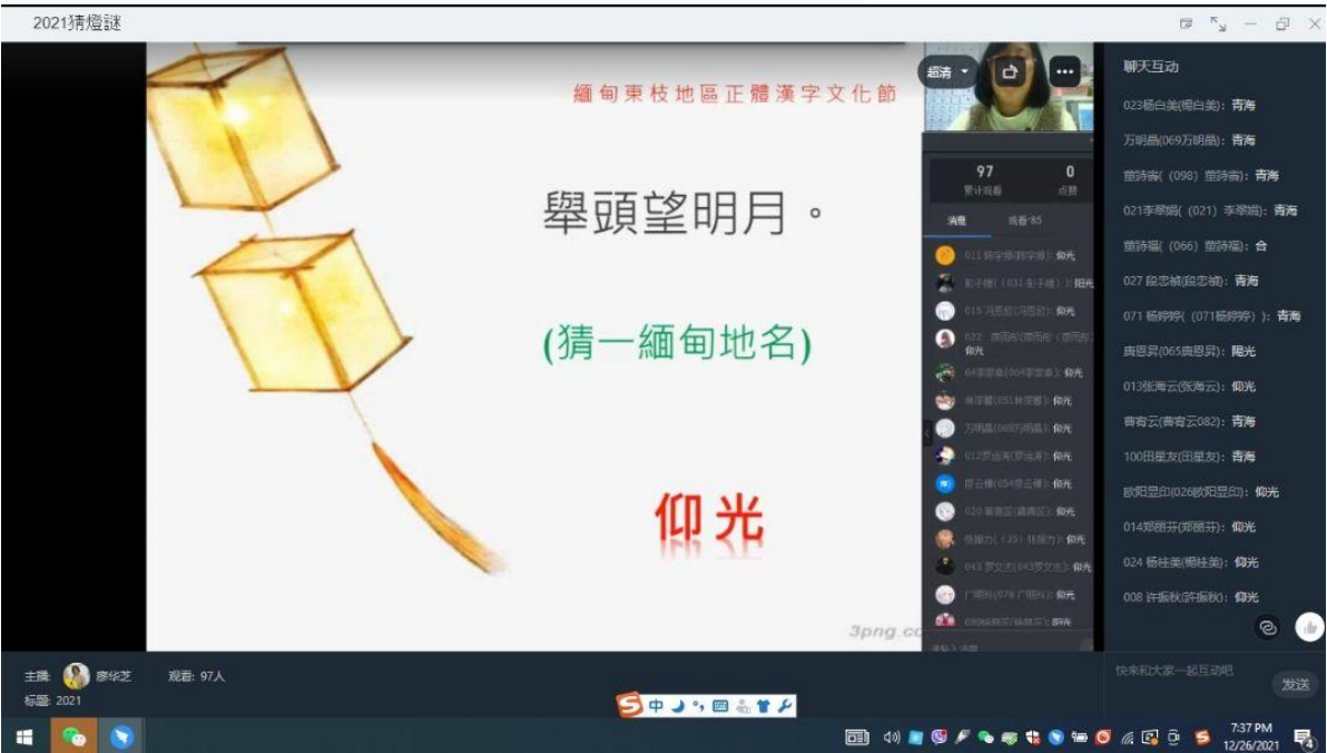
東枝興華學校猜燈謎活動內容多元，本圖為猜地名