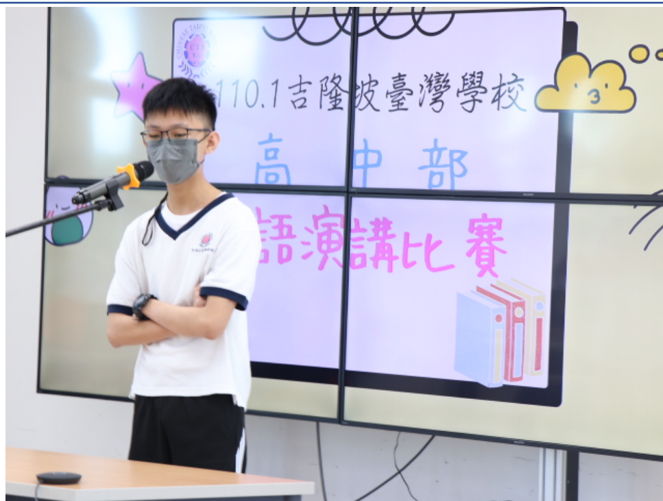
現場參賽的參賽者（高中組）