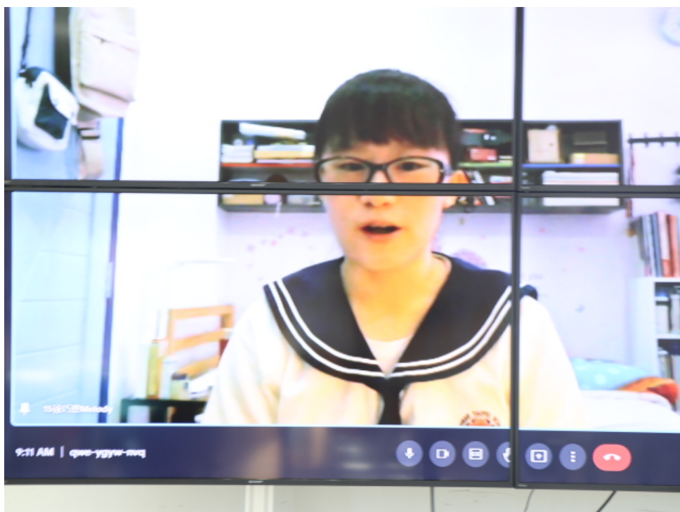
部分參賽者在線上參加比賽（高中組）