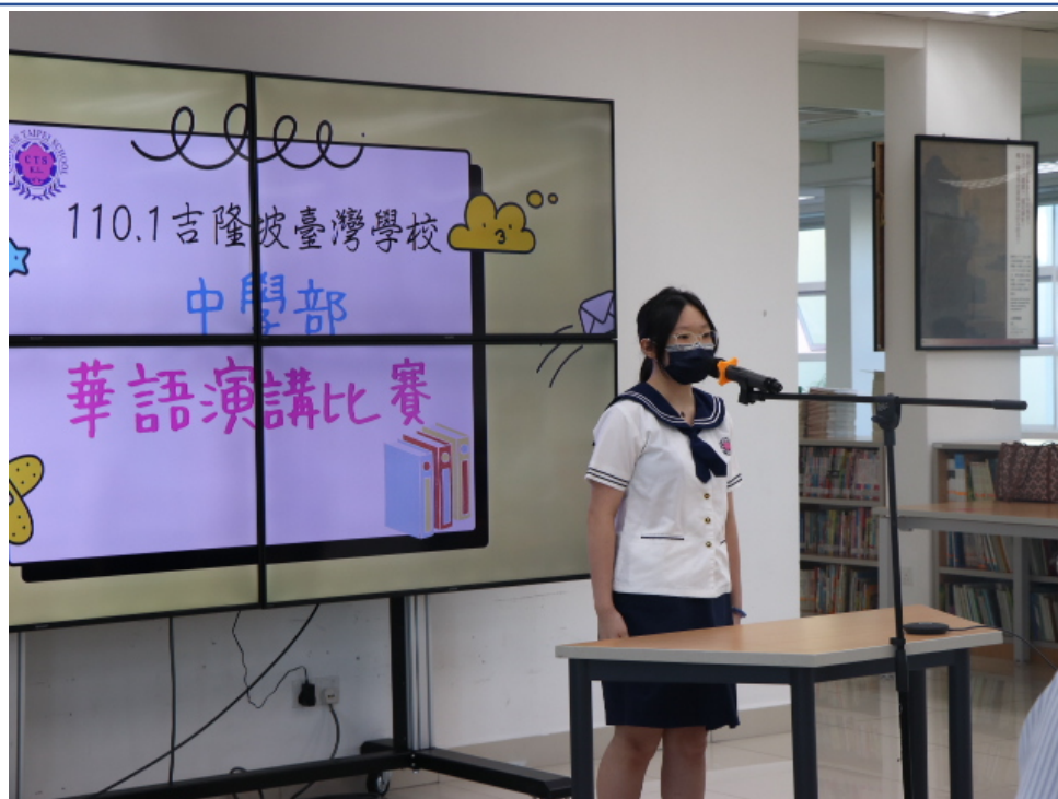
現場參賽的參賽者（國中組）