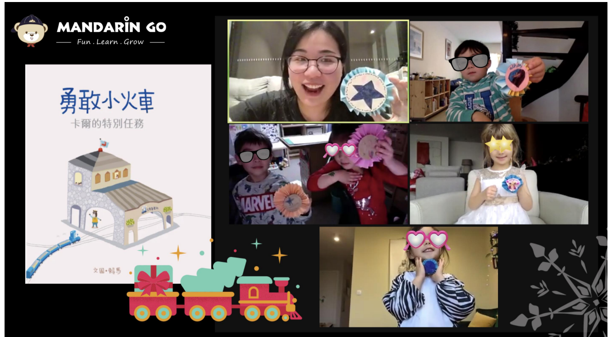
《勇敢小火車》繪本故事 - 勇敢勳章