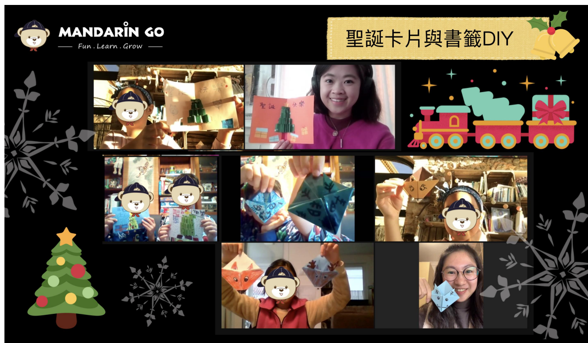
立體聖誕卡片製作與麋鹿書籤製作