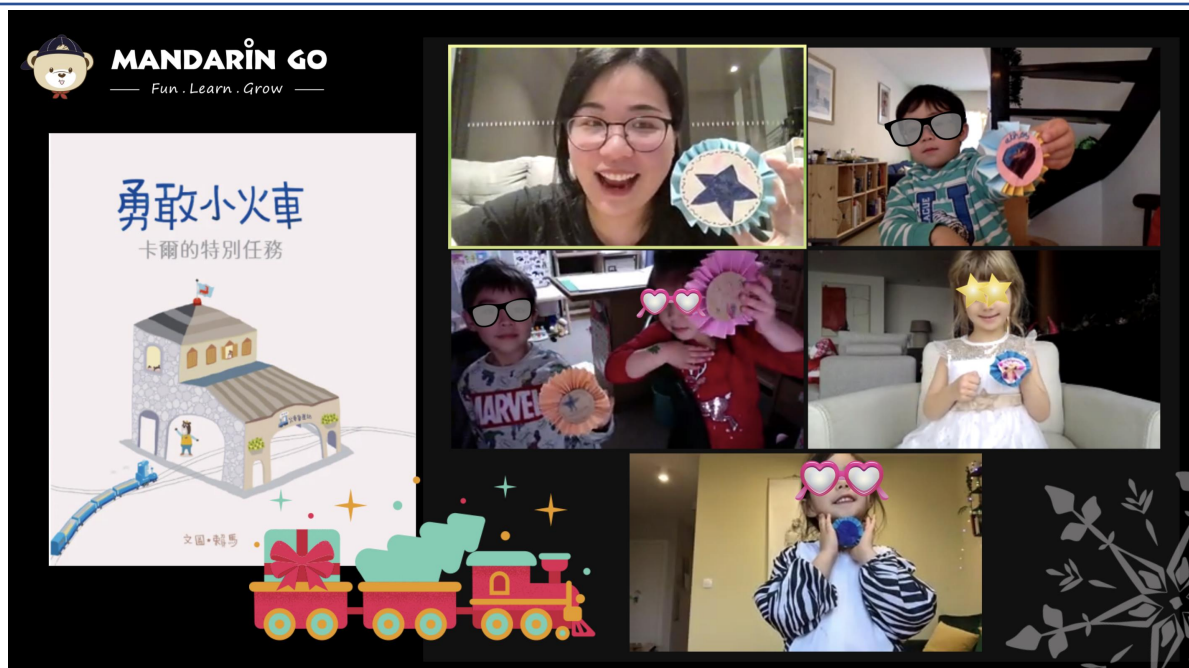
《勇敢小火車》繪本故事 - 勇敢勳章