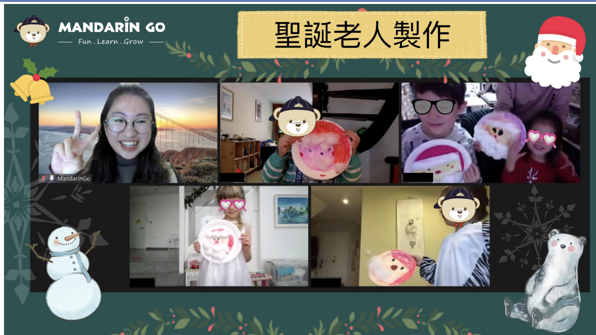
聖誕節的由來與活動 - 聖誕老人