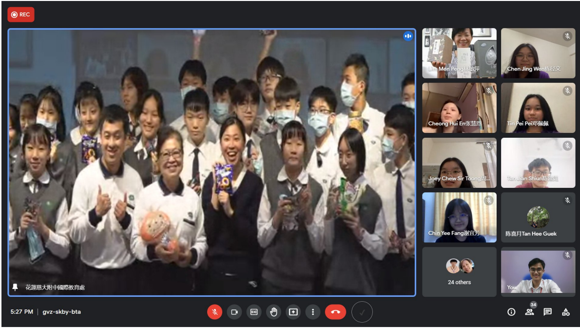
來張大合照~ (2021. 11. 16)