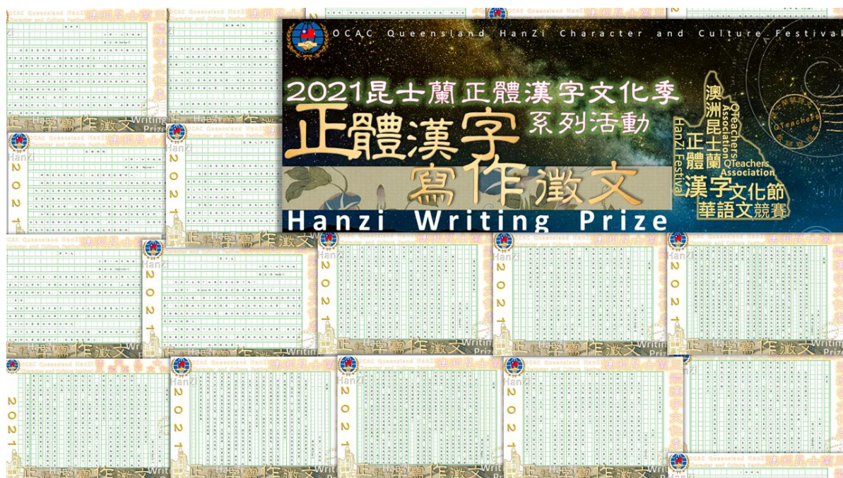
昆士蘭華語文教師聯誼會正體漢字寫作徵文活動1

110年度昆士蘭正體漢字文化季系列活動因疫情改變形式進行並延後辦理，活動仍致力於僑居地推廣正體漢字書寫和生活美學，藉由文字與文化活動之推廣宣傳，鼓勵當地學子與社會人士體驗正體漢字之美，廣泛提升華語文學習興趣，傳承及弘揚優良中華文化。本年度因疫情沒能舉辦的朗讀與硬筆字書寫比賽，詢問度仍然相當踴躍。主辦單位感謝大家對於正體漢字文化季持續的愛護與支持！