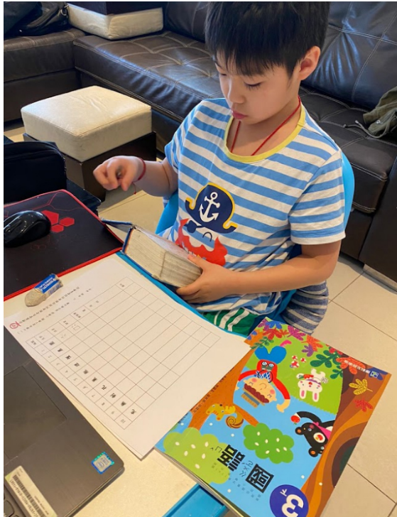
110學年度愛育學校 正體漢字文化節「全校查字典比賽」3