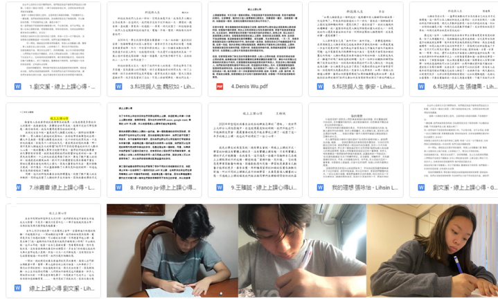
臺灣基督長老教會阿根廷教會附設愛育學校110學年度愛育學校 正體漢字文化節「全校作文比賽」3