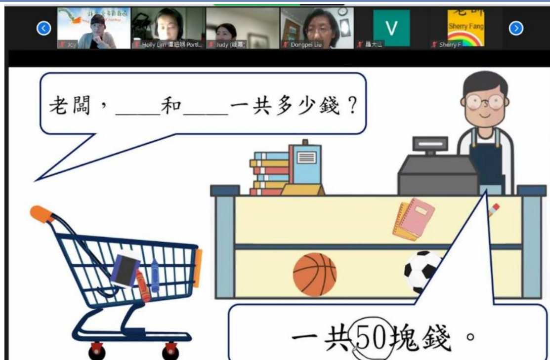
華語向前走第一冊範例