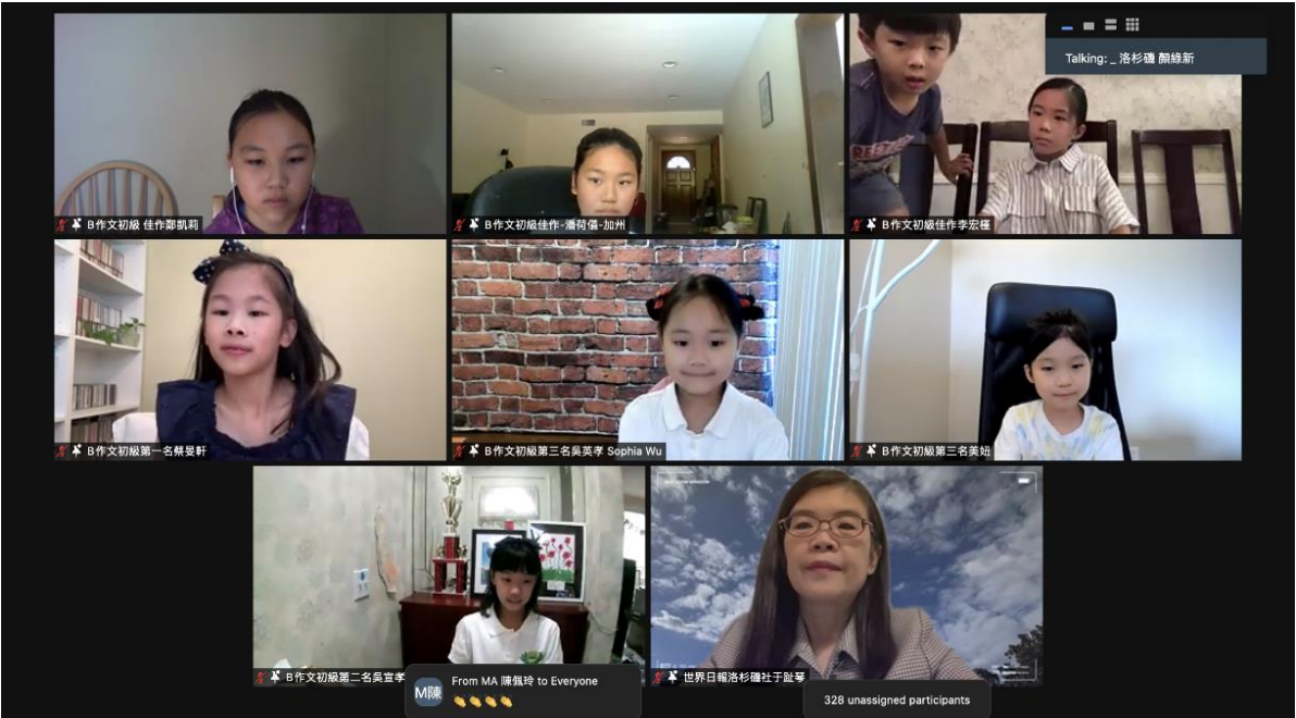
世界日報于趾琴社長與初級組得獎學生合影