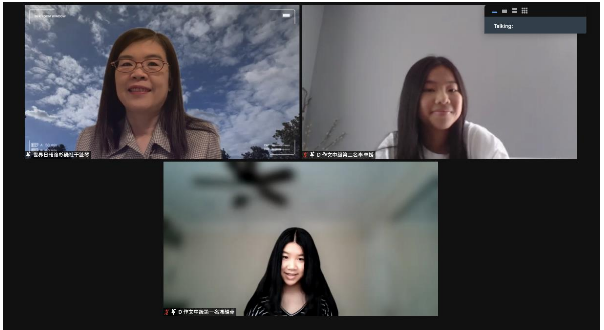
世界日報于趾琴社長與中級組得獎學生合影