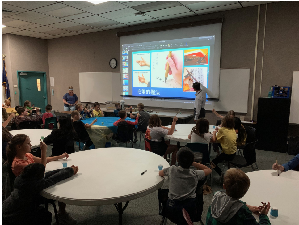
傳統書法握筆手法與書寫技巧