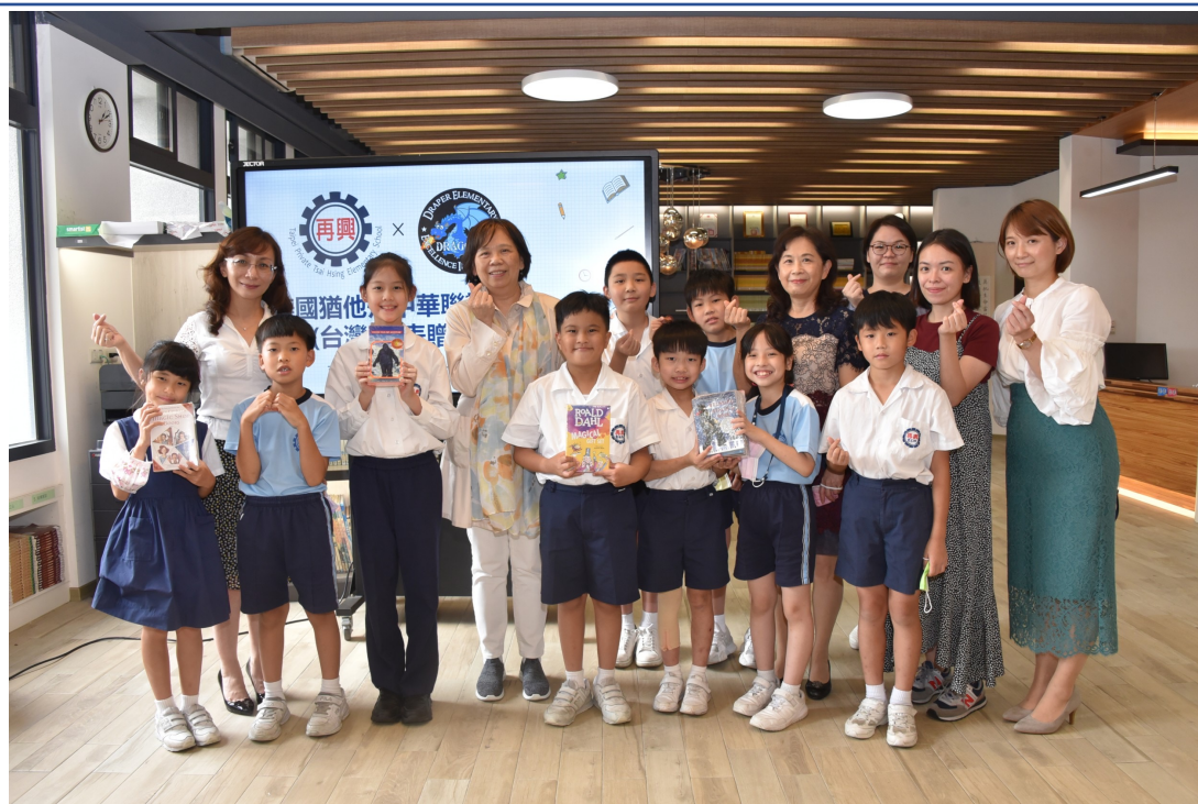
北市再興小學師生感謝猶他州中華聯誼會贈送優良叢書