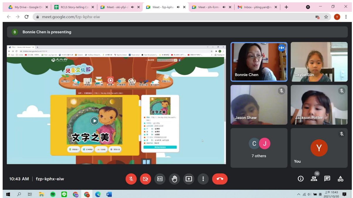
注音一年級班學習漢字文化

此次文化日改為線上教學，雖然增加了老師課程準備上的挑戰，也無法讓老師們能臨場示範或指導學生親手操作體驗。但是老師們在教學內容的製作上，卻更精美詳盡，不但能吸引學生們的注意，也讓其他家庭成員有機會一起學習了漢字文化知識。