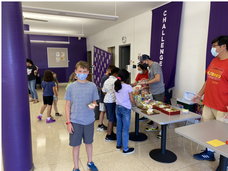
朗讀比賽完畢品嚐月餅。

9/26/21下課以後，我們學校提供一些月餅給同學們分享，順便學習一下中秋佳節的故事和喜悅。中文學校也利用教師節，在下課後，請老師們共聚一堂享吃晚餐。