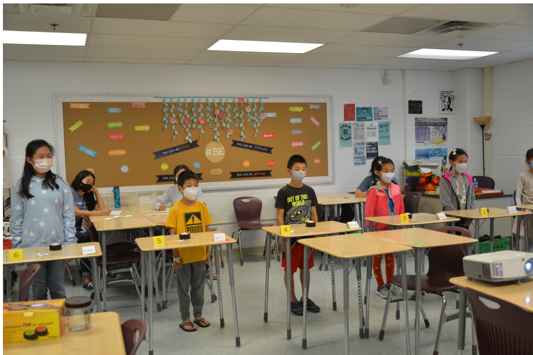
維華中文學校成語分梯比賽現場