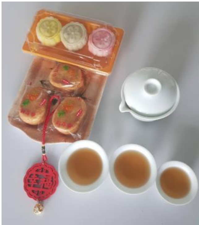
與老師舉行中秋節茶會

學生們從這些活動中，學習到中秋的文化意涵，也感受到過中秋節的歡樂氣氛。學生投入活動的熱情及伴隨的笑聲，應該是本次各班活動成功的最佳指標。