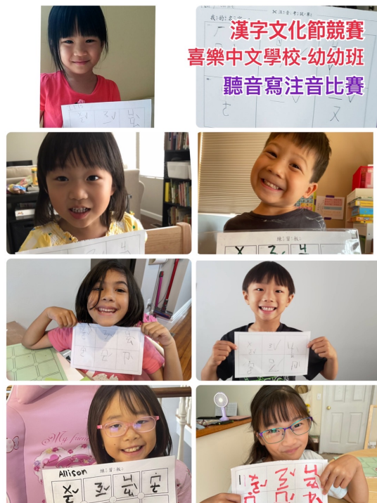
2021-Q2 幼幼班1. jpg