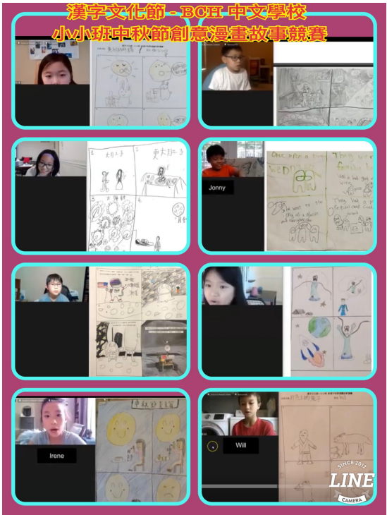
2021-Q3 小小班1. jpg