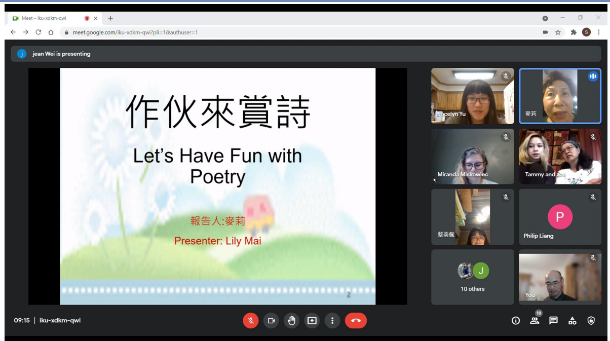
美國明尼蘇達州臺灣線上圖書館舉辦2021漢字節「想想一首我的詩」4