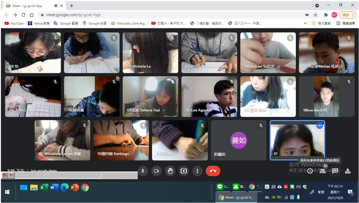
阿根廷華興中文學校中學部硬筆字活動3