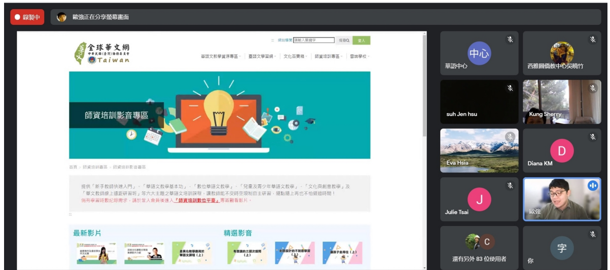
歐喜強老師說明全球華文網師資培訓教學影音資源