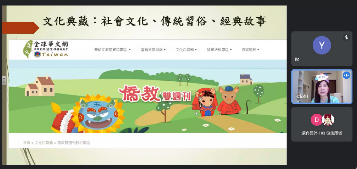
張憶如老師「文化典藏在華語數位教學上的創意與應用」