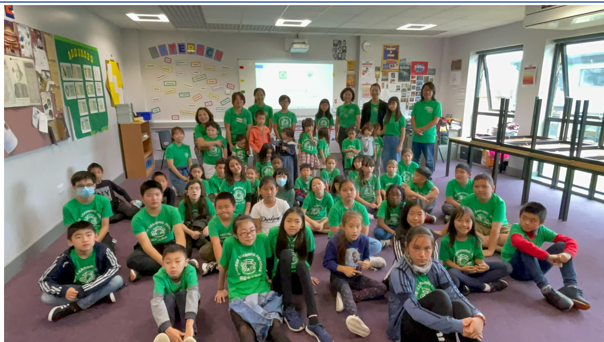
華園國際學伴交流計畫-破冰活動3