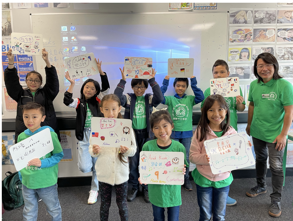
華園國際學伴交流計畫-破冰活動1

華園中文學校在僑委會國際學伴計畫的配對下，與臺北健康國小成為國際學伴，兩校雙方都對此計畫非常的積極和熱衷，自配對以來，便積極溝通、開會，已整合出整學年的國際學伴計畫活動。雙方於九月開學後，經過兩三星期的準備時間，協助學生進行目標語的自我介紹練習和錄影，然後多次開會套論進行學伴配對和調整溝通，兩校也進行全體師生大合照及拍攝全體打招呼影片。華園於10月2日中文課結束後，全體師生集合，介紹國際學伴交流計畫，並認識健康國小的地理位置及學校特色，接續播放健康國小寄來的破冰活動影片，讓學生有機會看到自己的學伴的中英文自我介紹，隨後讓每個學生錄製他們給學伴的中英文介紹影片，為了讓國際學伴能更清楚或聽懂每個學生的中文自我介紹，當天中文課堂由授課教師協助每個學生將其自我介紹的內容事先或寫或畫摘要記錄在小白板上供錄影時使用，結束後並將錄影檔及照片上傳雲端寄給健康國小，讓他們於學校的晨光時間播放給學校師生看，完成第一階段的破冰和相見歡活動。