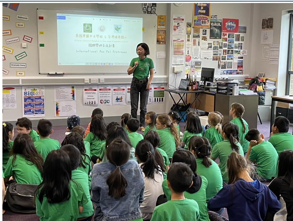
華園國際學伴交流計畫-破冰活動2