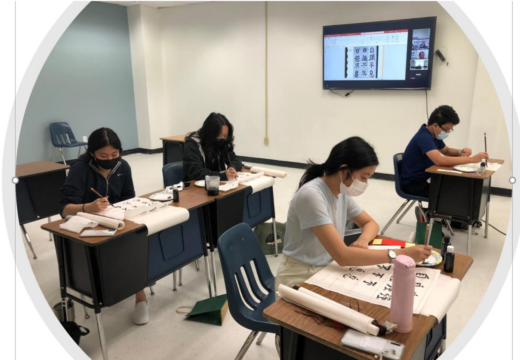
自創線上和實體混合教學