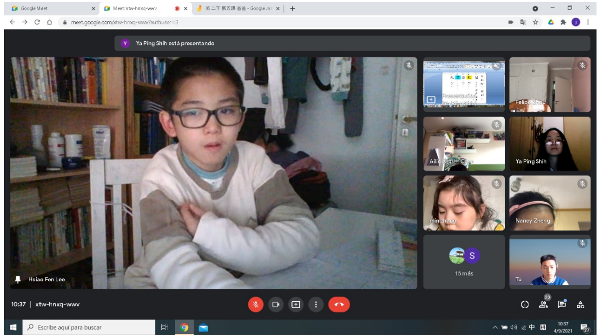
110學年度愛育學校 正體漢字文化節 「小學部中低年級組造詞比賽」6