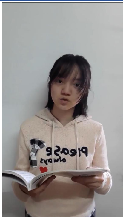
110學年度愛育學校 正體漢字文化節「朗讀比賽」5