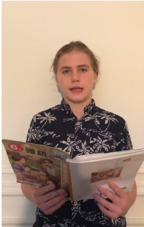
110學年度愛育學校 正體漢字文化節「朗讀比賽」6