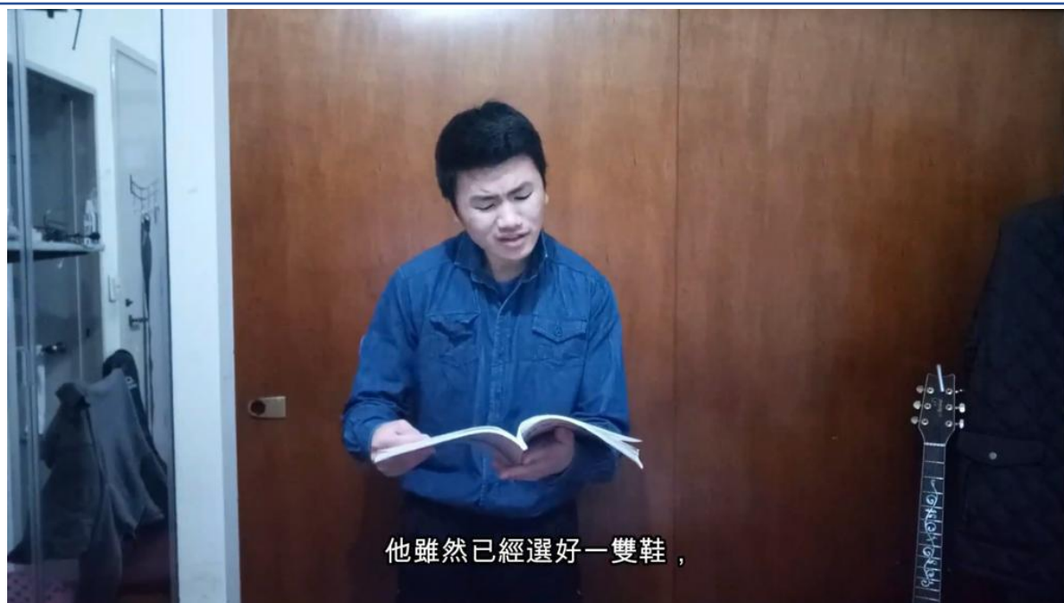
110學年度愛育學校 正體漢字文化節「朗讀比賽」2