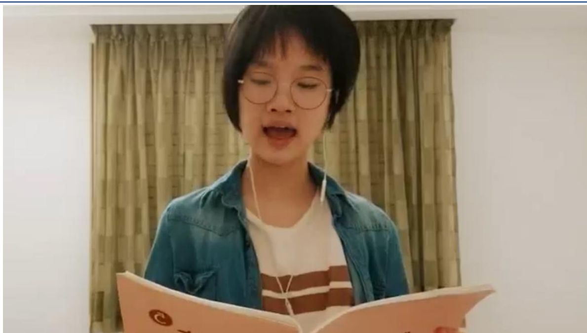
110學年度愛育學校 正體漢字文化節「朗讀比賽」1