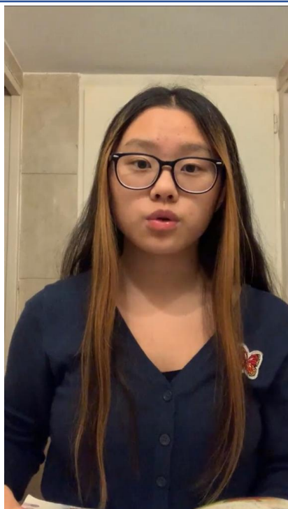
110學年度愛育學校 正體漢字文化節「朗讀比賽」4