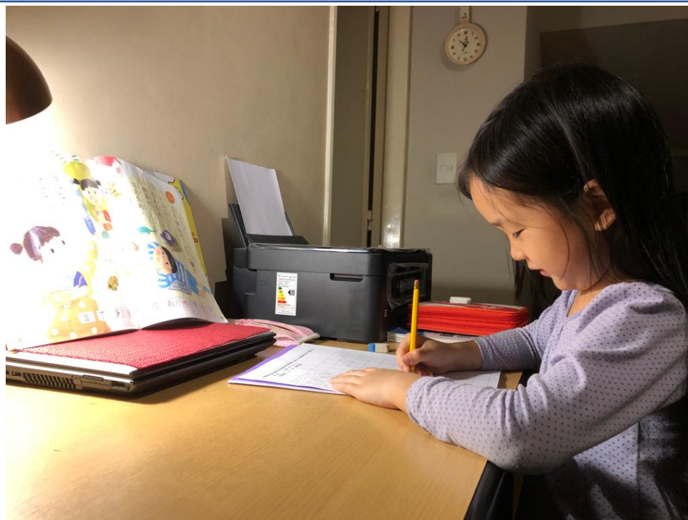
110學年度愛育學校 正體漢字文化節「全校寫字比賽」4