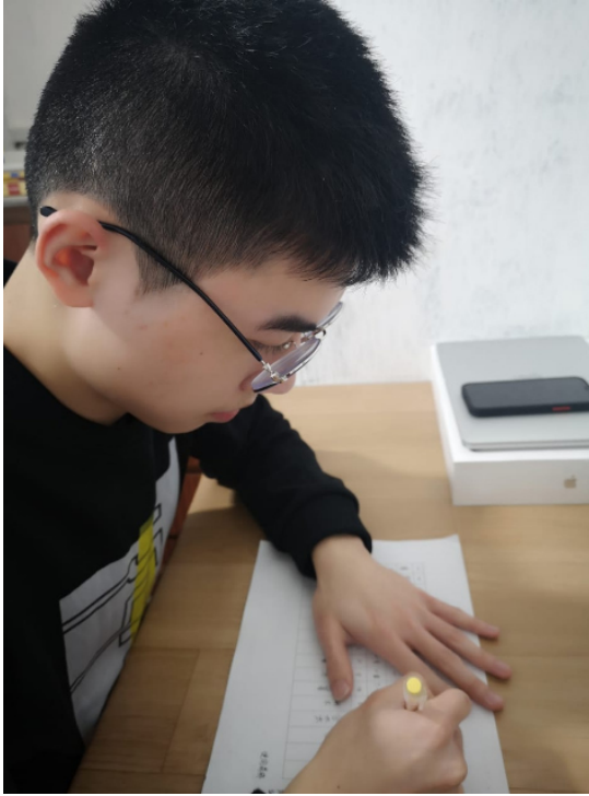
110學年度愛育學校 正體漢字文化節「全校寫字比賽」6