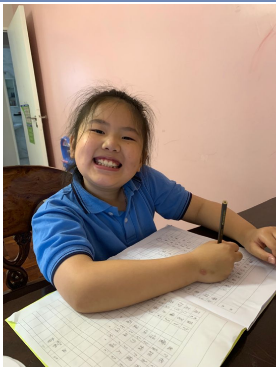
110學年度愛育學校 正體漢字文化節「全校寫字比賽」1