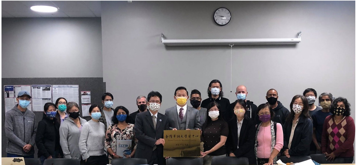
2021年矽谷中文學校臺灣華語文學習中心秋季班開學首日大合照