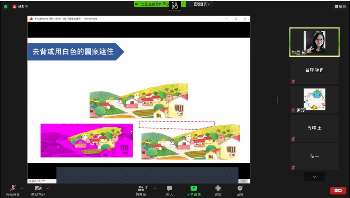
阿根廷華興中文學校 首都外省教師ppt研習(進階)3