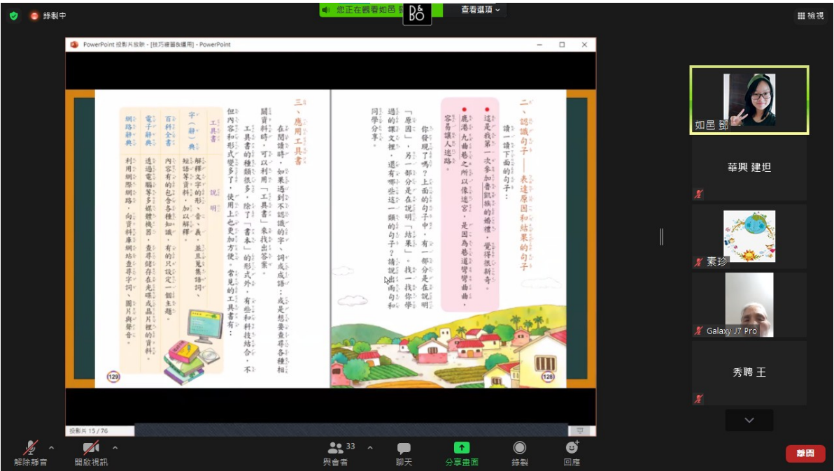
阿根廷華興中文學校 首都外省教師ppt研習(進階)2