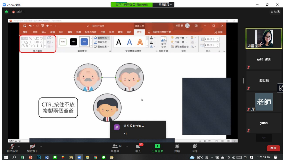
阿根廷華興中文學校 首都外省教師ppt研習(進階)6