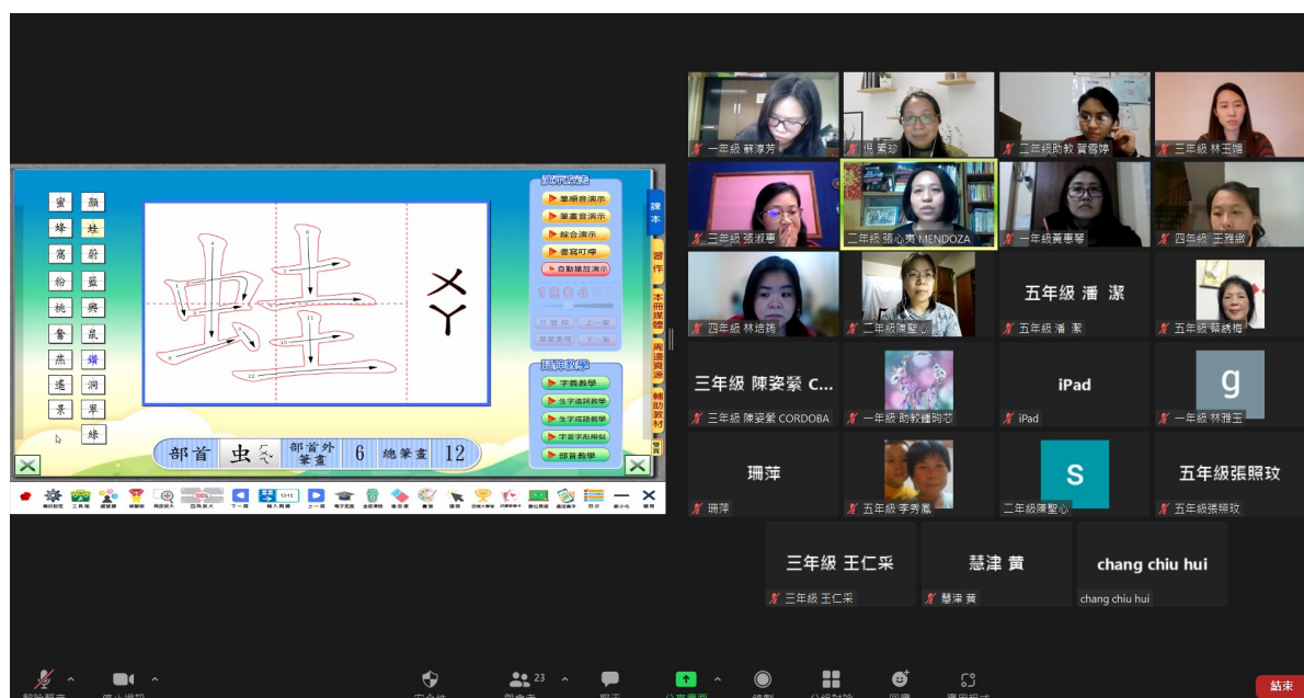
阿根廷華興中文學校110學年度 首都外省教師線上教學研習課程5