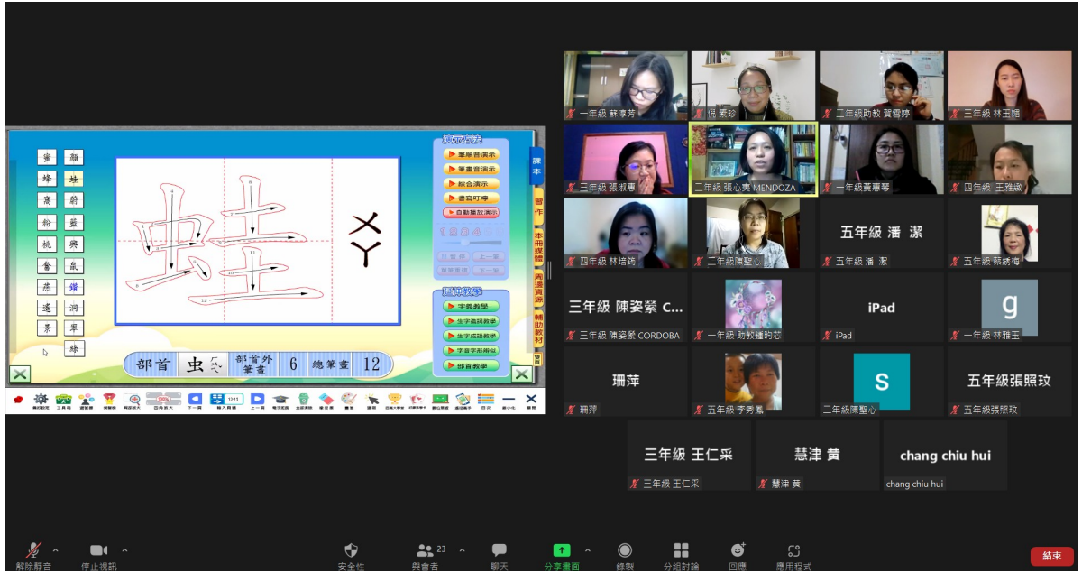
阿根廷華興中文學校110學年度 首都外省教師線上教學研習課程5