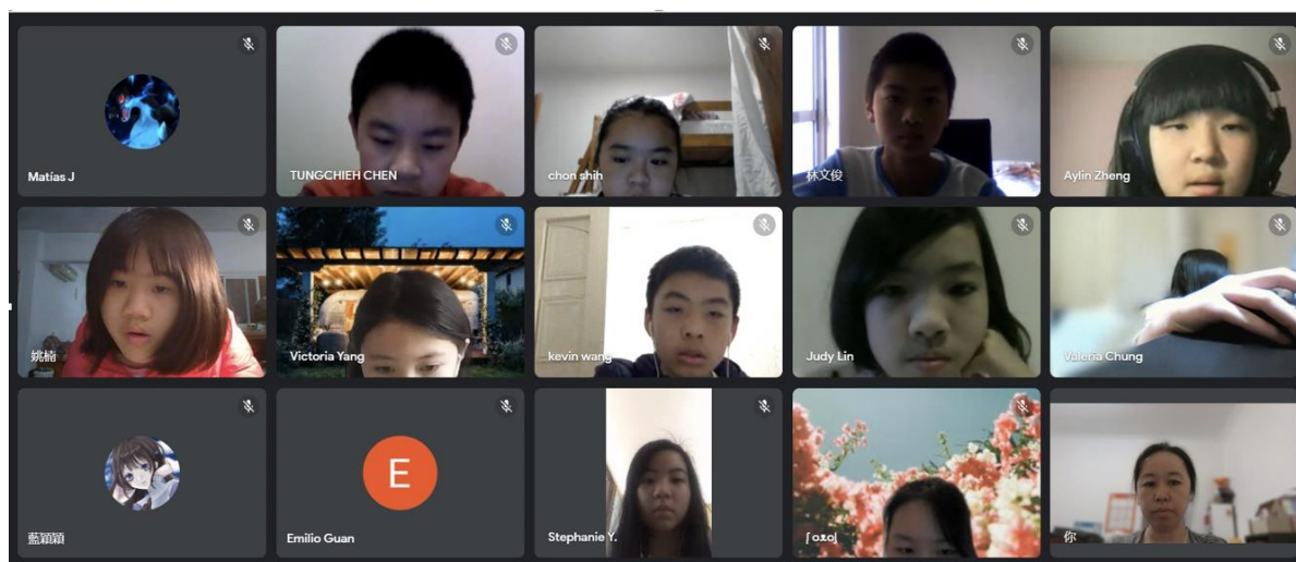
新興教會附屬中文學校中、高年級查字典比賽1