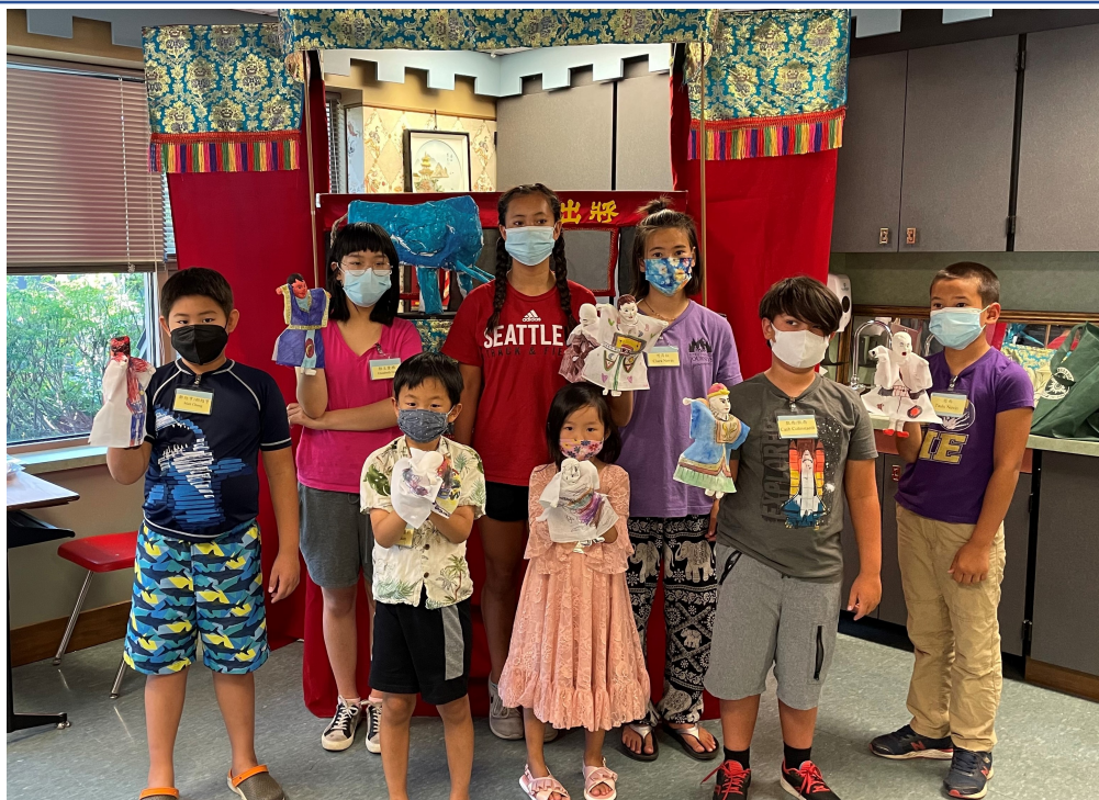
學員自製布袋戲偶。