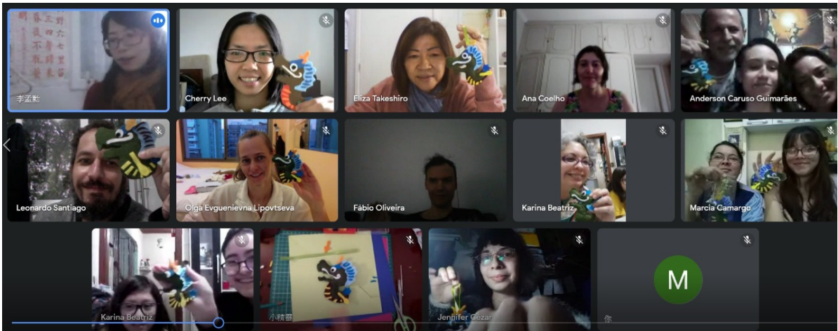
龍舟飾品製作體驗