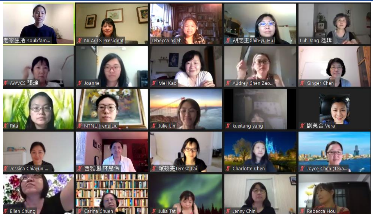
參與培訓的老師們(三)