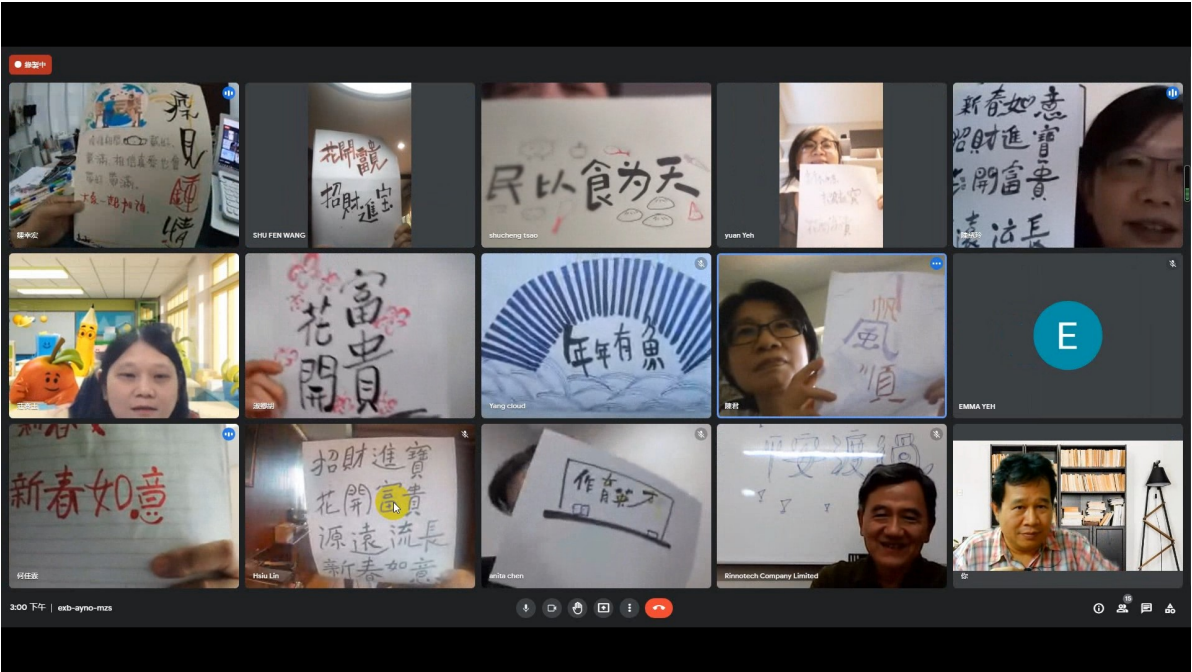
漢字文化節系列-漢字揮毫研習活動