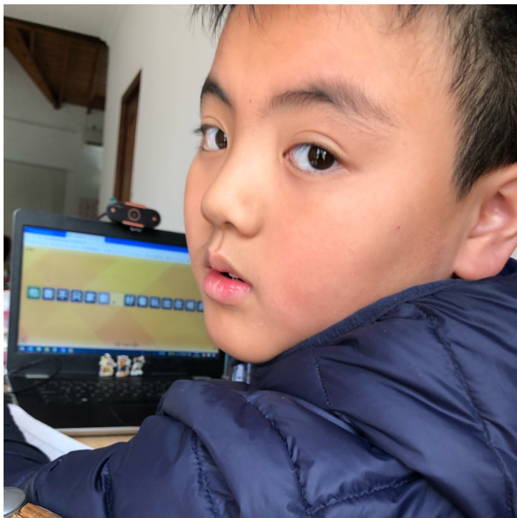
新興中文學校 2021 低年級句子排排看比賽（線上）1