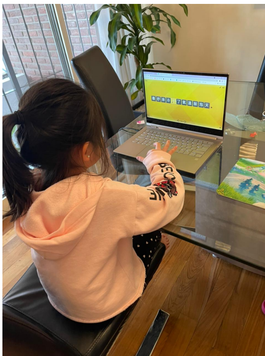
新興中文學校 2021 低年級句子排排看比賽（線上）3