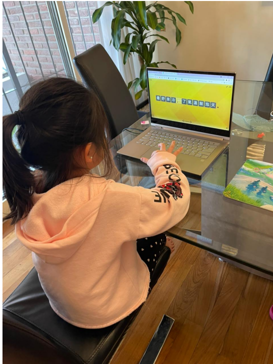
新興中文學校 2021 低年級句子排排看比賽（線上）3