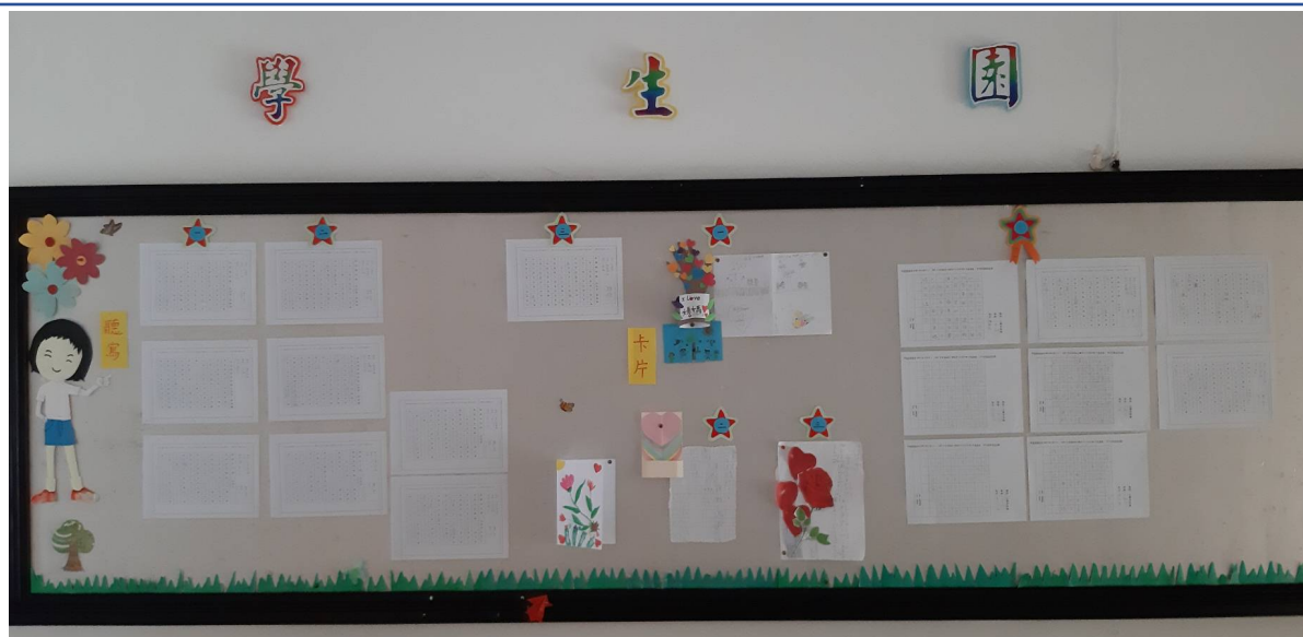
聽寫與卡片製作比賽得獎作品張貼於學生園地