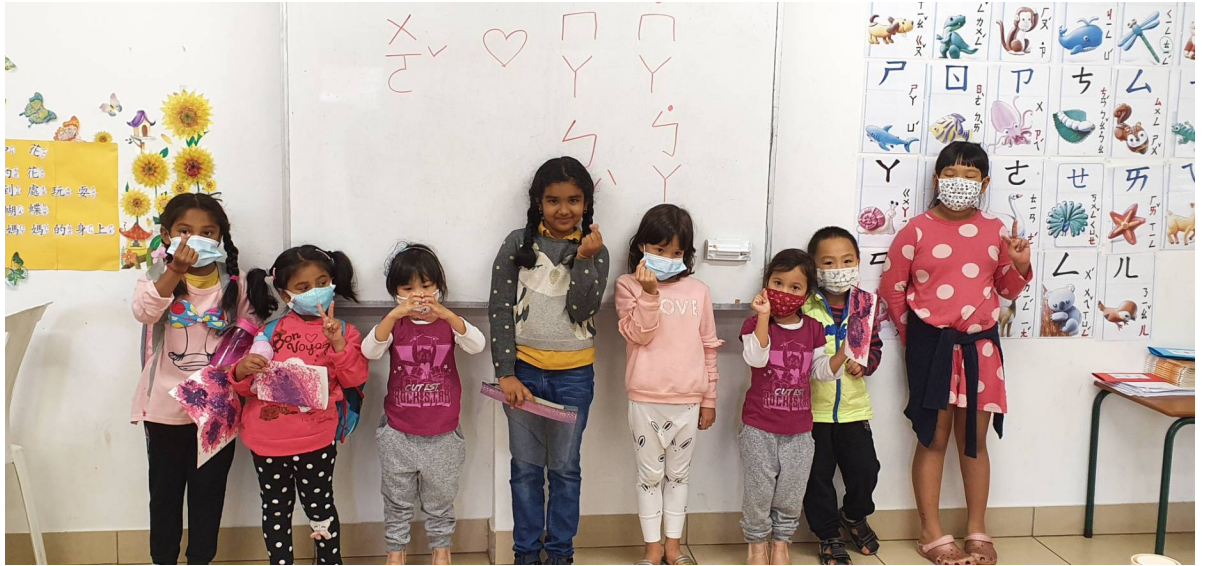
基礎班同學由老師指導做手工祝福卡