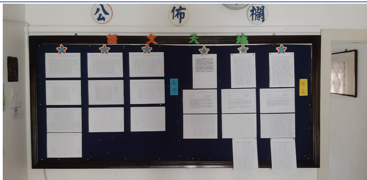
作文與美字比賽得獎作品張貼於學生園地