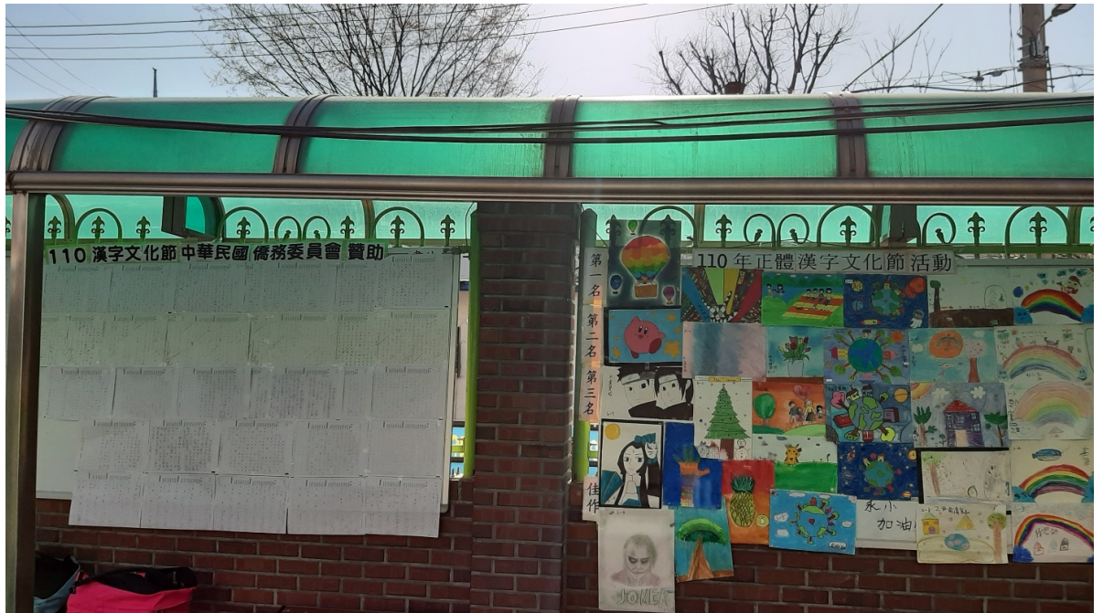
韓國永登浦華僑小學 2021 正體漢字文化節活動3