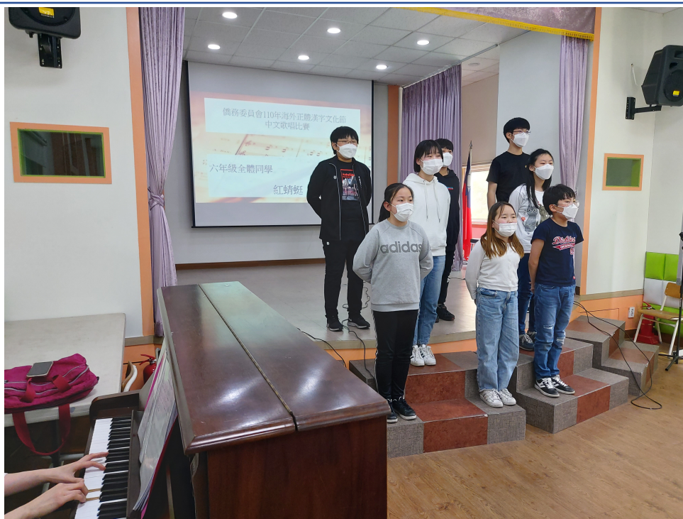
韓國永登浦華僑小學 2021 正體漢字文化節活動5