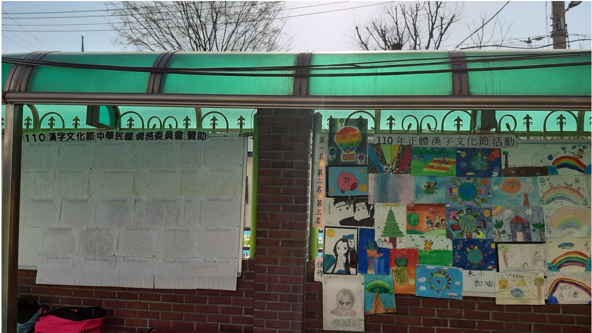
韓國永登浦華僑小學 2021 正體漢字文化節活動3