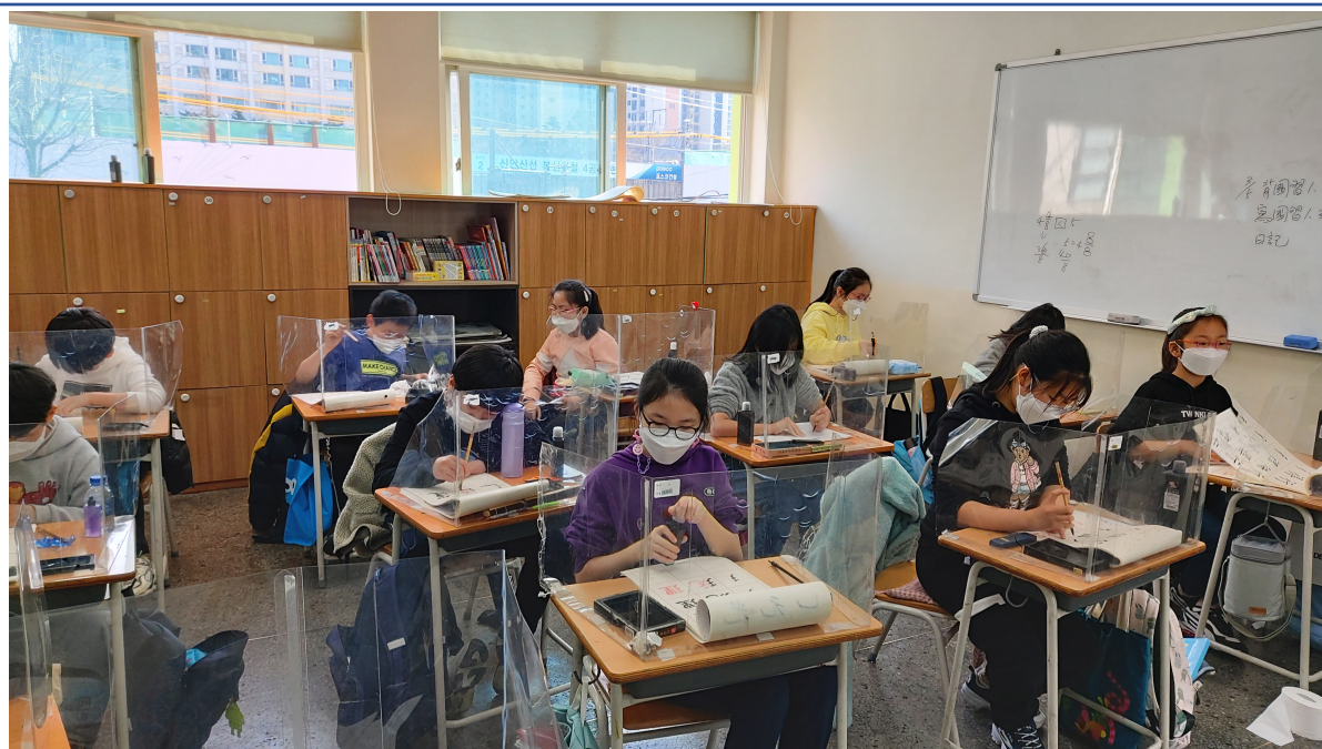
韓國永登浦華僑小學 2021 正體漢字文化節活動2