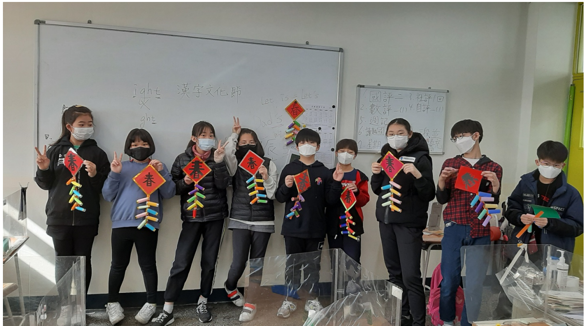
韓國永登浦華僑小學 2021 正體漢字文化節活動1