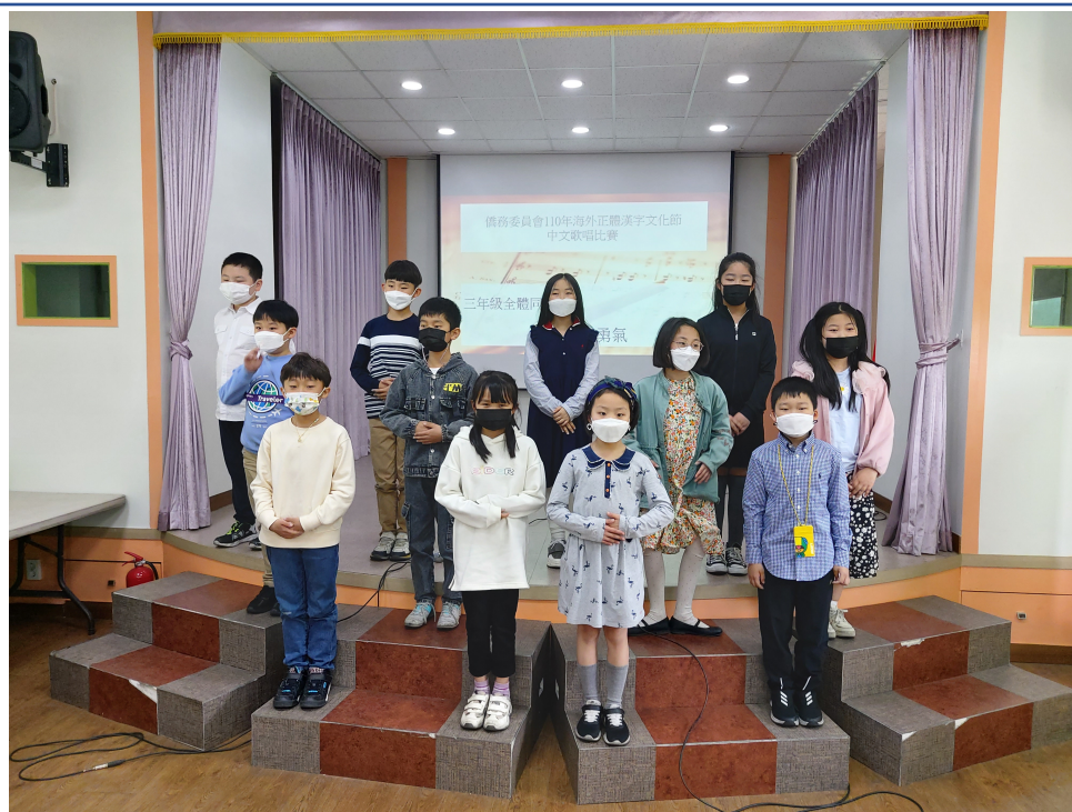
韓國永登浦華僑小學 2021 正體漢字文化節活動4