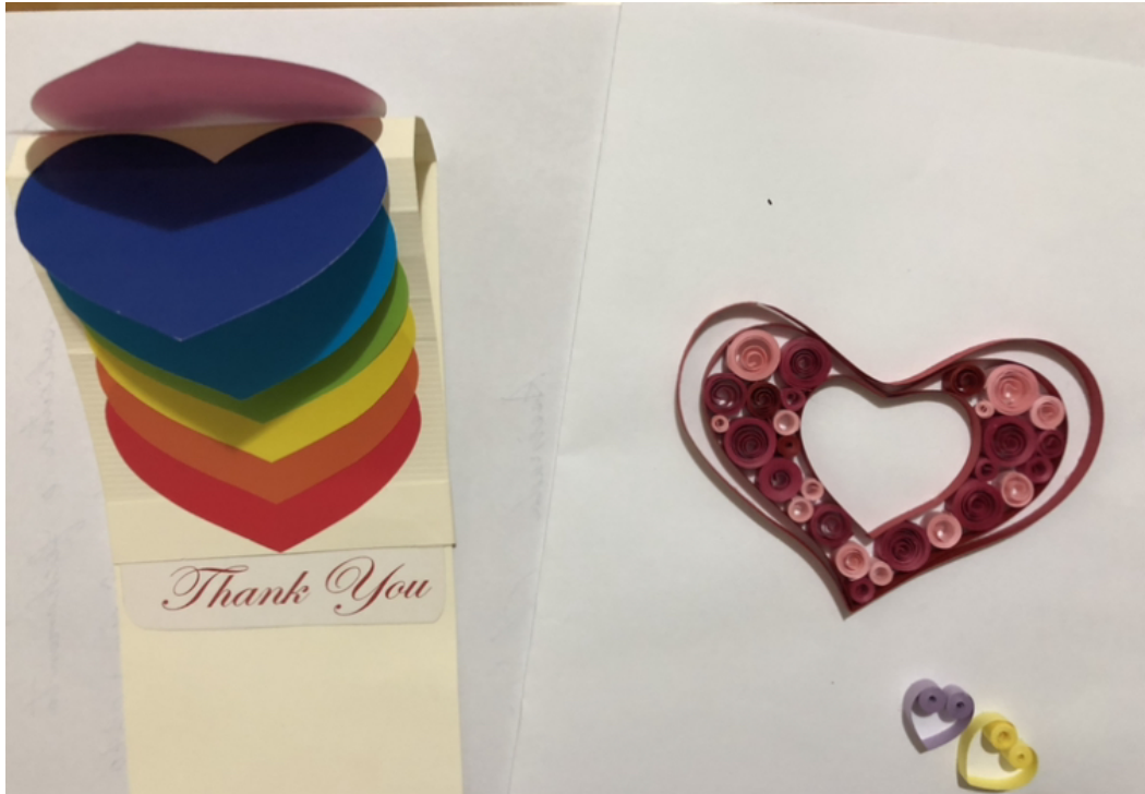
為老師們安排的母親節立體卡片製作課程