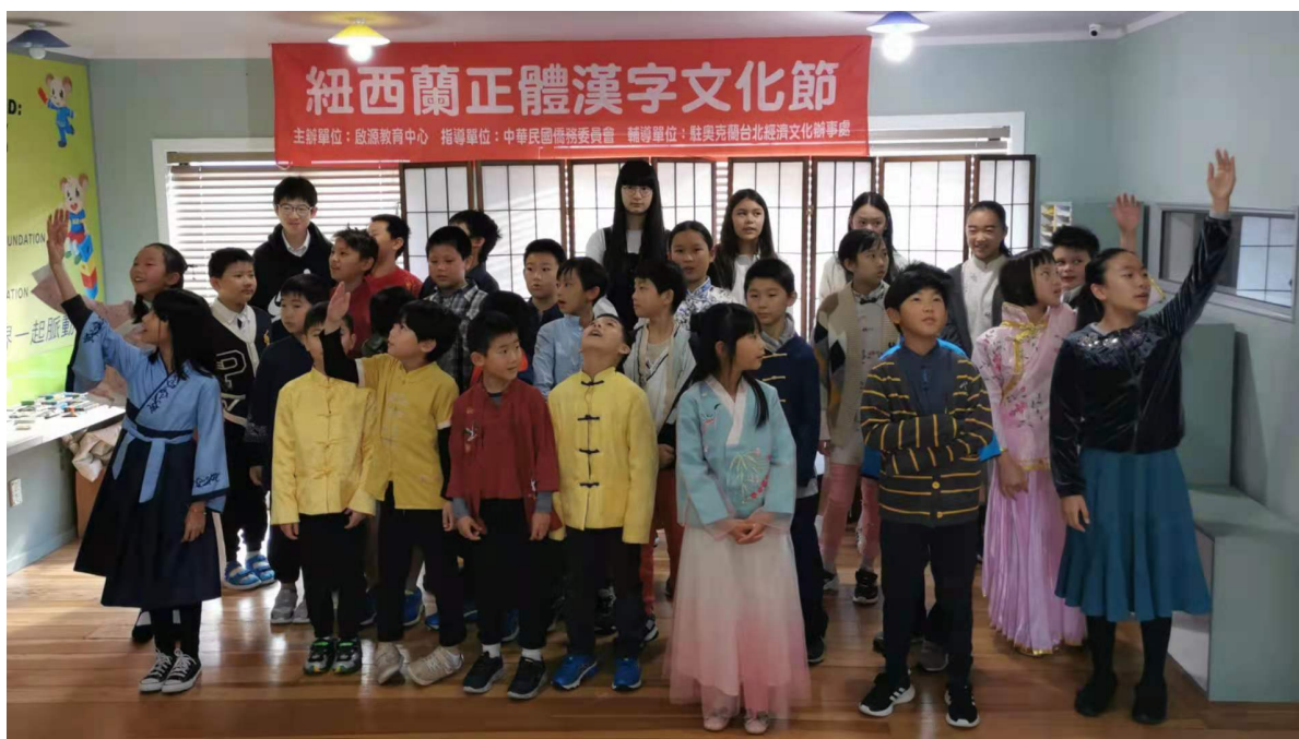
學生表演唐詩—靜夜思。