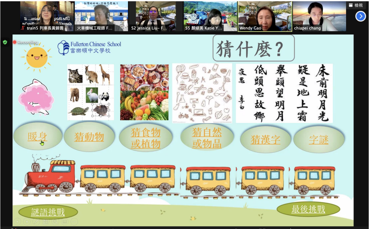
猜字活動緊張又有趣