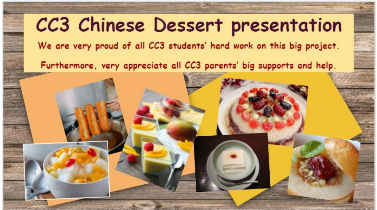
6年級的參賽作品—臺灣甜點私房食譜