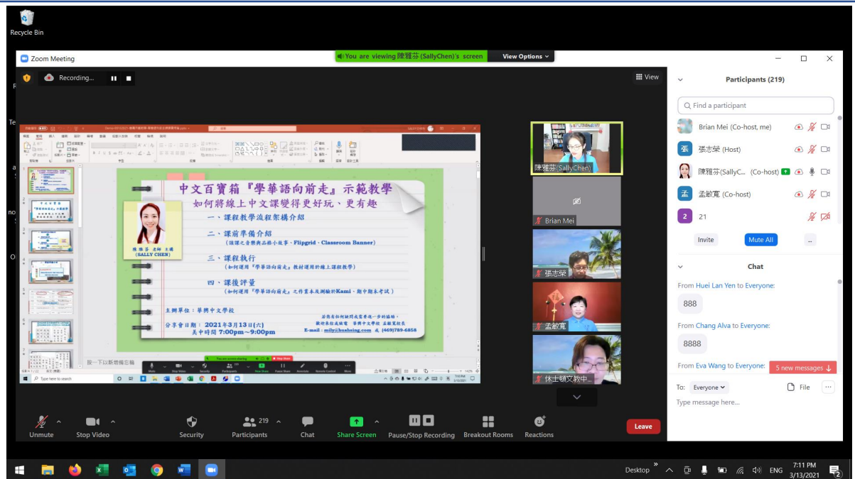
《學華語向前走》示範教學