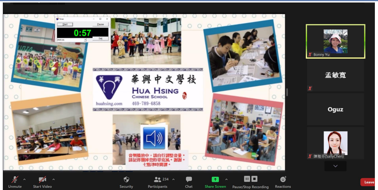
華興中文學校主辦的漢字文化節教師培訓