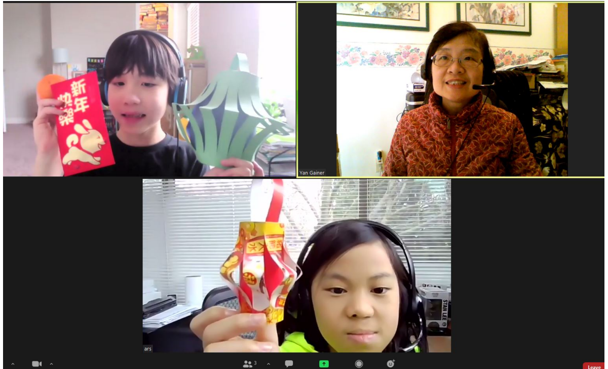
3年級班一分享學員在家慶祝新年所收到與製作的事物。