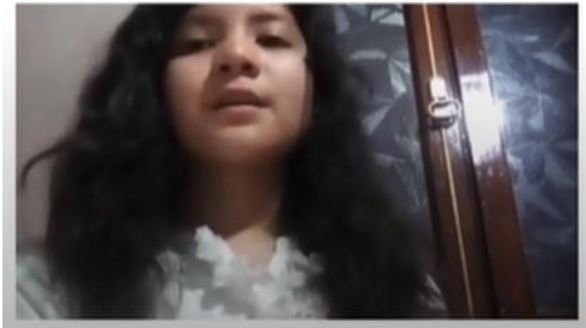
新興教會附屬中文學校 2020 全校歌唱比賽（線上）5