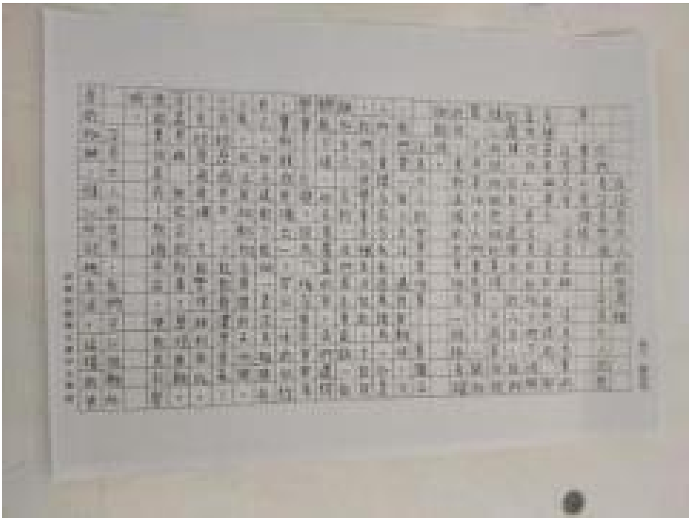
新興教會附屬中文學校 2020 全校作文比賽3