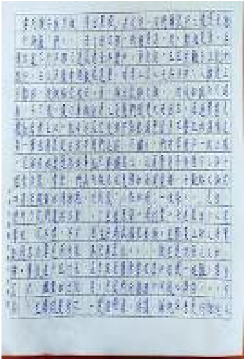
新興教會附屬中文學校 2020 全校作文比賽4