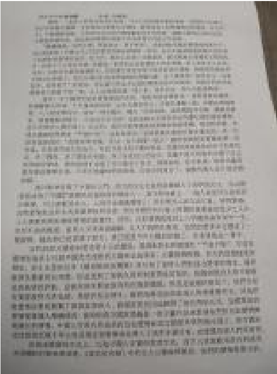
新興教會附屬中文學校 2020 全校作文比賽1