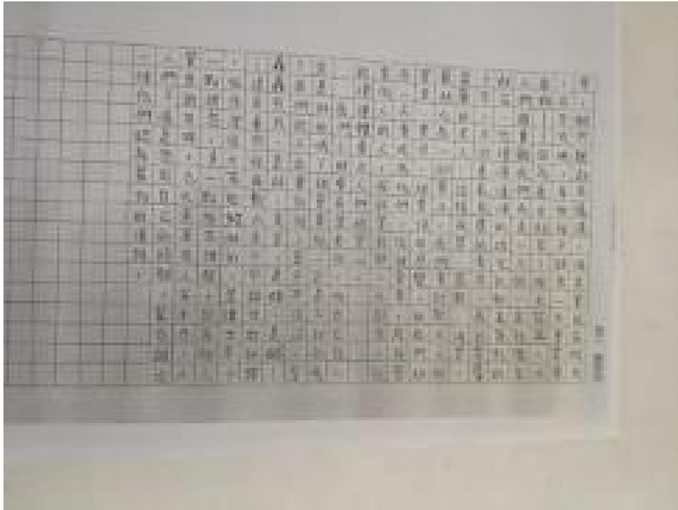
新興教會附屬中文學校 2020 全校作文比賽6