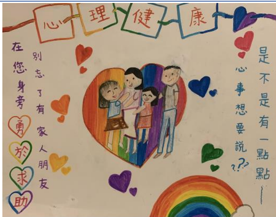
親子海報創作得獎作品