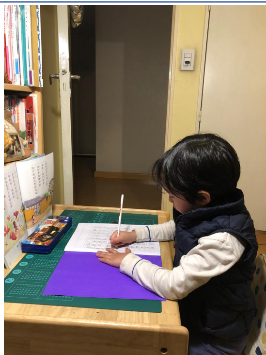
臺灣基督長老教會阿根廷教會附設愛育學校 2020 正體漢字文化節：硬筆字書寫比賽4